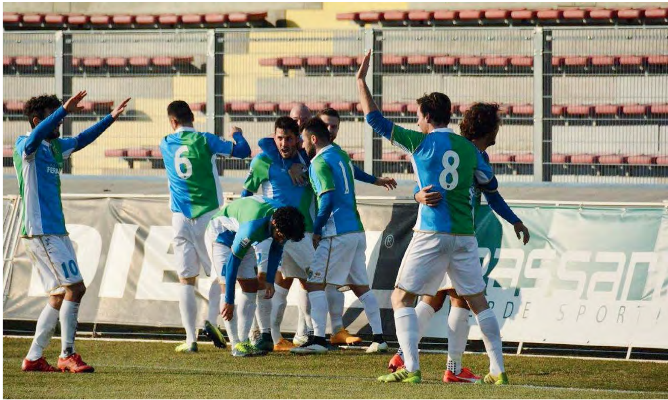
Avanti tutta. La FeralpiSalò punta ad altri tre punti con la Pro Patria

* classificata in Serie B - 2 a e 3 a e le 2 migliori 4 a tra i 3 giorni ai play off. Dalla 14 a all'17 a ai play out - 18 a in Serie D