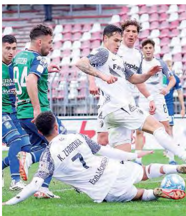
Letizia. Buono il rientro in campo del giocatore napoletano

Come si era visto anche in presa diretta, bene hanno