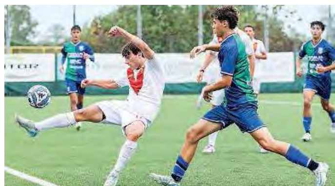
Partita intensa. Tra FeralpiSalò e Brescia, al Rigamonti di Buffalora

sa rimangono in dieci per l'espulsione di Nasti. Qui comincia un'altra gara, ma i salodiani riescono a raddoppiare e poi a difendere fino alla fine il vantaggio anche dopo il 2-1 delle rondinelle.