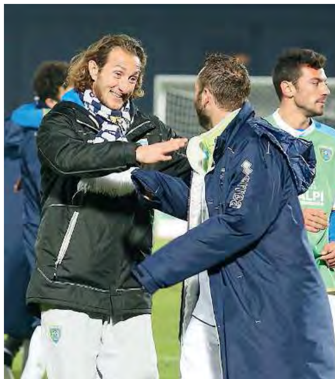
Festa. Diana esulta dopo il successo di Cittadella. Un entusiasmo da sfruttare