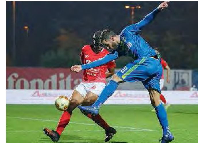
Raddoppio. De Cenco quasi dalla linea di fondo trova il varco giusto