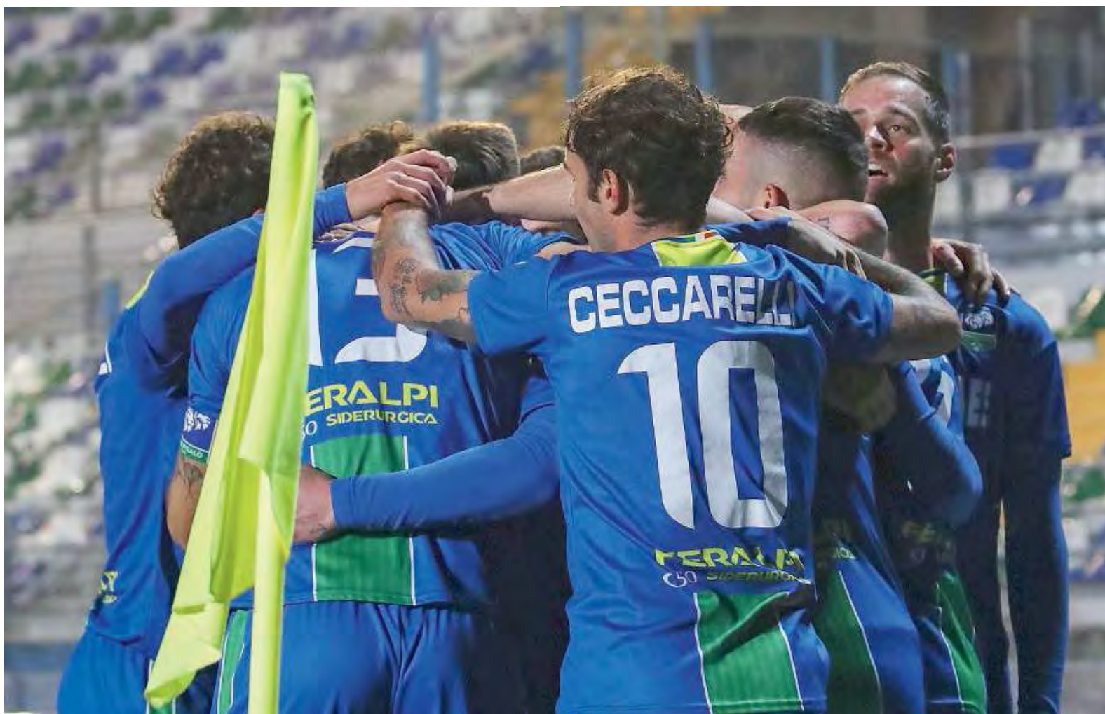
Esultanza. Grande festa per una vittoria pesante

6.5 - Caio De Cenco Il primo gol in campionato vale tre punti d'oro. Dal 24' lo rileva un Luca Miracoli (6) sempre utile, pure in difesa. // F. D.