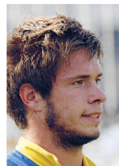
Castagnetti centrale di centrocampo