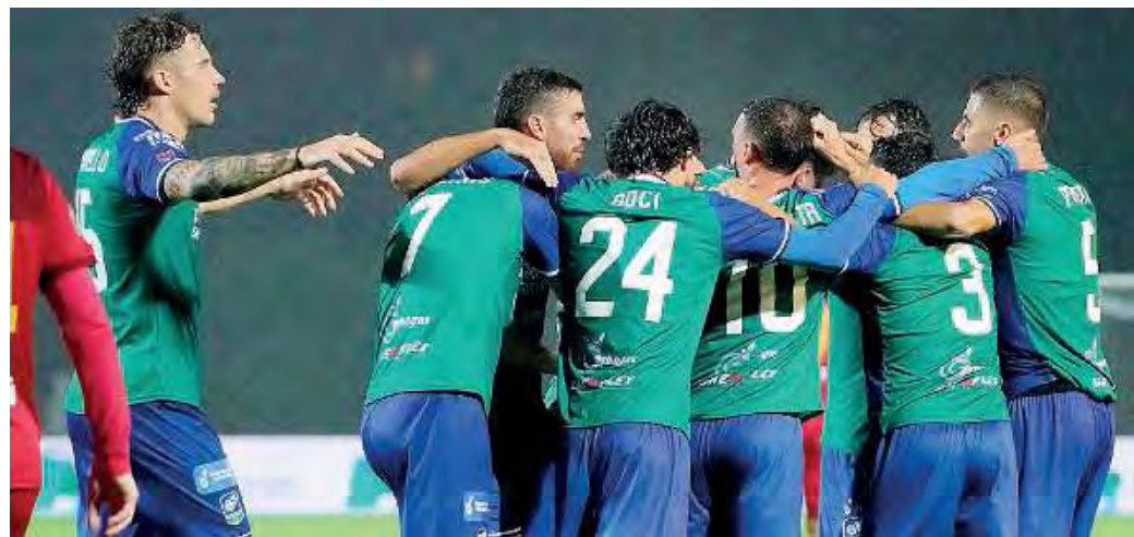
Per l'importante bis. La FeralpiSalò cerca la seconda vittoria consecutiva in casa