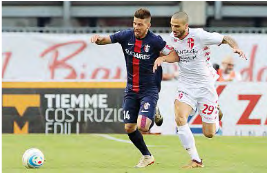
Duello in velocità Un'avanzata di Soleri contrastata da un difensore della Sambenedettese

ro in mente il tema da sviluppare, ossia cambiare quattro giocatori rispetto all'undici che ha pareggiato con la Sambenedettese.