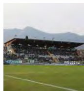
Lo stadio «Lino Turina» di Salò

In occasione del match odierno tra Feralpisalò e Imolese lo stadio «Turina» riaprirà al pubblico in modo parziale. Sarà consentito l'accesso a 150 persone, fra tribuna scoperta alta e settore ospiti. I posti sono riservati solo alla tifoseria locale. Vendita online, al link https://www.diyticket.it/events/5port/4140/feralpisalò-imolese , saldando con carta di credito o prepagata. Indispensabile l'iscrizione gratuita al portale. Oppure è possibile telefonare allo 06 4046 tra le 9 e le 13 e dalle 14 alle 18 o recarsi in uno dei punti SisalPay.